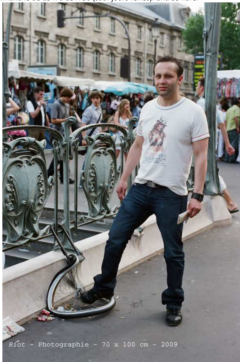
Riot - Photographie - 70 x 100 cm - 2009

du mardi au dimanche de 15 h à 18 h 30 (sauf jours fériés). Entrée libre.